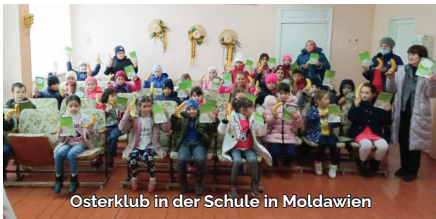
Osterklub in der Schule in Moldawien